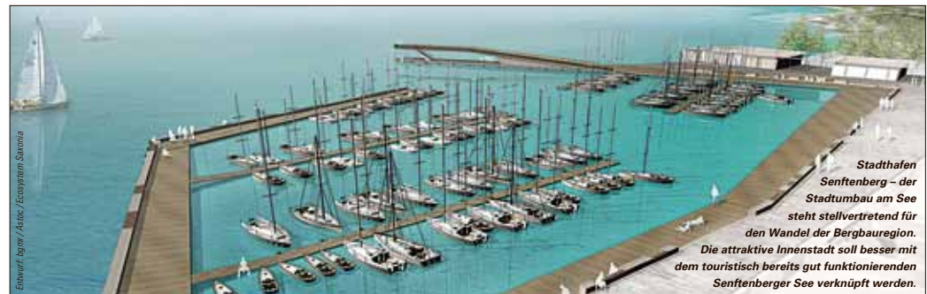
Stadthafen Senftenberg – der Stadtbau am See steht stellvertretend für den Wandel der Bergbauregion. Die attraktive Innstadt soll besser mit dem touristisch bereits gut funktionierenden Senftenberger See verknüpft werden.