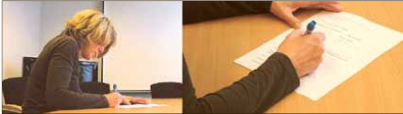
Etwa 1.800 Kunden des GWAZ nahmen sich für die Beantwortung des Fragebogens Zeit.

Meinungsumfrage zur Arbeit des Zweckverbandes mit positiver Resonanz/Entgelte im Fokus der Verbraucherkritik