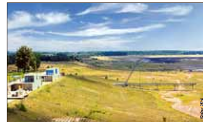
Im Zentrum – 2005 wurde an den IBA-Terrassen in Großräschen ein 63 m langer Steg errichtet, der in den zukünftigen Ilse-See reicht.

Insgesamt sieben Veranstaltungen mit 20 Aufführungsterminen hat er inszeniert – siehe Programmleiste. Unter seiner Regie werden Landschaften zur eindrucksvollen Bühne und die Menschen der Lausitz zu Künstlern. Mehr als 1.000 Lausitzer sind bereits in die Vorbereitungen einbezogen. Darüber hinaus finden zahlreiche Partnerveranstaltungen an den IBA-Projekten statt. Elf spannende Thementouren führen zu Fuß, per Bus, Rad, Jeep oder Floß vom „Mars“ zu Industriegiganten, entstehenden Seen und zu anderen Attraktionen.