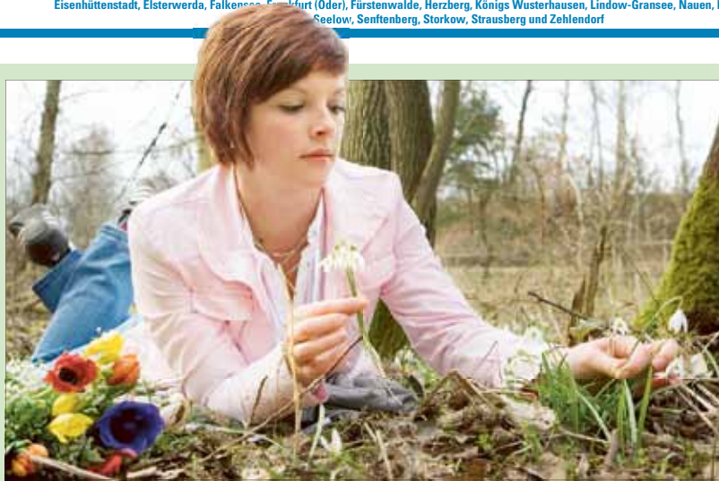
Der GWAZ wünscht allen Kundinnen und Kunden frohe Ostern und angenehme Frühlingsentdeckungen bei Ausflügen in die Natur!

Herausgeber: Gubener Wasser- und Abwasserzweckverband sowie Wasserunternehmen in Bad Freienwalde, Birkenwerder, Brück, Buckow, Cottbus, Doberlug-Kirchhain, Eisenhüttenstadt, Elsterwerda, Falkenberg, Frankfurt (Oder), Fürstenwalde, Herzberg, Königs Wusterhausen, Lindow-Granshe, Nauen, Peitz, Rathenow, Rehnsberg, Seelow, Senftenberg, Storkow, Strausberg und Zehlendorf