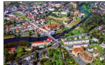
Grenzerfahrung – die Gubiner Hauptkirche (vorn rechts). Hier soll ein deutsch-polnisches Begegnungszentrum entstehen.