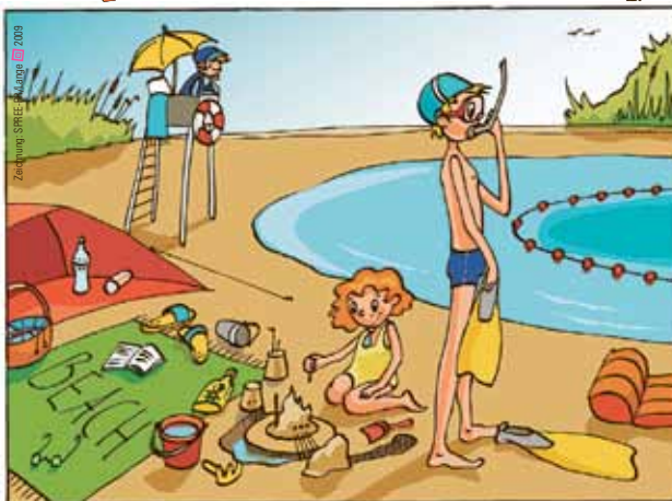
Zuordnung: STRICH • Ausgabe 2009

Wir wissen, noch ist es nicht soweit. Aber was gibt's schöneres, als sich bei heißen Temperaturen in die kühlen Fluten zu stürzen? Auch Tröpfchen und Strahl hat es an den Badeseen gezogen. Sie haben sich mit allem notwendigen für den ganzen Bade-tag ausgerüstet. Findet auf dem Bild die sechs Sachen, die mit dem Wort Bade- anfangen, so wie z. B. Bade anstalt. Übrigens sind die Badegewässer in Brandenburg von vorzüglicher Qualität. 255 Badestellen werden in der Saison regelmäßig von den Gesundheitsbehörden kontrolliert. Vier Seen dürfen sich sogar mit der „Blauen Flagge“, dem Gütesiegel für die beste Wasserqualität, schmücken. Dafür, dass die Gewässer so rein sind, sorgt auch euer Wasserunternehmen. Es klärt die Abwässer aus den Haushalten und der Industrie und führt sie dann sauber in die Natur zurück.