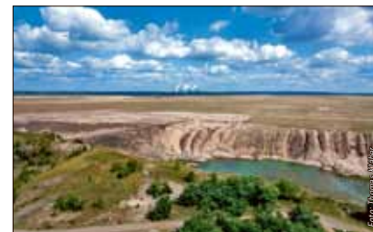
Wasser in Sicht – mit Auslaufen des Tagebaus Cottbus-Nord entsteht der größte Binnensee der Niederlausitzer Tagebaulandschaft.