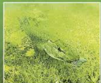
Nicht nur die Hechte finden den Stechlin zum Anbeißen.