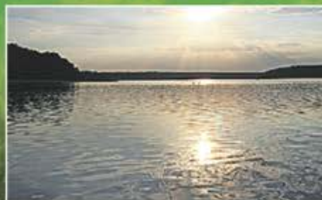
Beliebter Badesee dank flacher, sauberer Strände und kleiner romantischer Buchten.