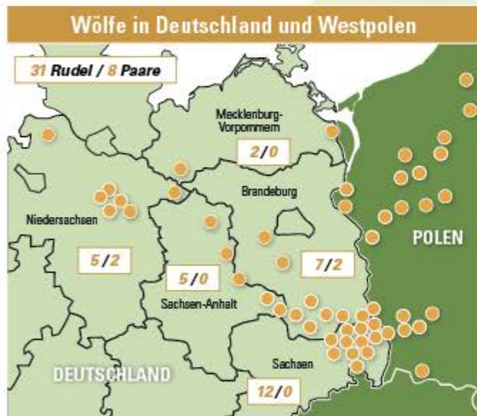
● Vorkommen von Rudeln und Paaren (ein Rudel besteht aus 2 erwachsenen Wölfen und in der Regel aus 2–10 Jungwölfen); ohne Einzelsichtungen. Stand Februar 2015; Quelle: NABU