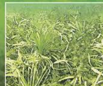
Die Krebschere gedeiht nur in sauberen Seen wie dem Stechlin.