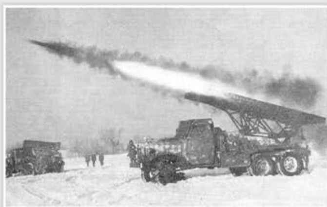
Eine Rakete vom Typ Katjuscha wird abgefeuert.