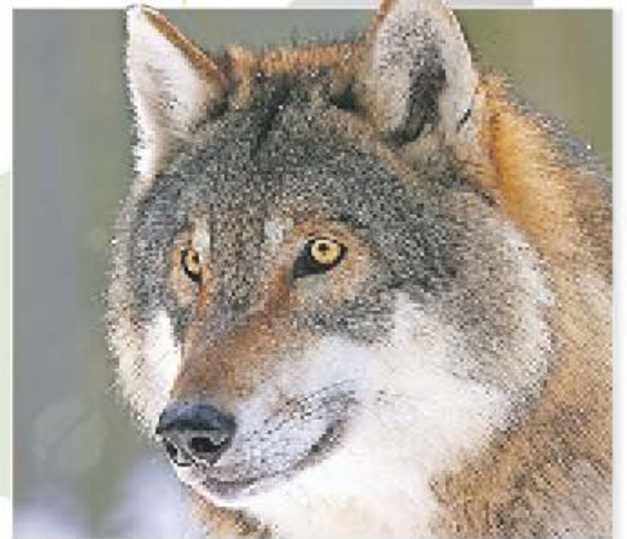
Wissenschaftlichen Untersuchungen zufolge vertilgt jeder Wolf pro Jahr etwa 67 Rehe, neun Stück Rotwild und 16 Sauen.

Das Wild ist unruhiger und scheuer geworden, stellen die Jäger fest. Rehe, Rotwild und Wildschwein stehen oben auf dem Speisezettel der Wölfe. Sie erbeuten zuvorderst die schwachen Tiere und üben damit eine regulierende Funktion aus. Was aber, wenn die Bestände an Schalenwild sinken und die schwachen Tiere ausgemerzt sind, während die Wolfspopulationen ungehindert wachsen. Was werden die grauen Jäger tun? Sich an Kuhherden an der Autobahn wagen? Was passiert, wenn Rinder in Panik auf die Fahrbahn durchbrechen? Das möchte man sich gar nicht vorstellen. Und doch wäre es sträflich, nicht auch solche Fälle zu durchdenken. Noch haben die Wölfe auf den Schalenwildbestand keinen großen Einfluss ausgeübt, das wird sich sicher ändern.