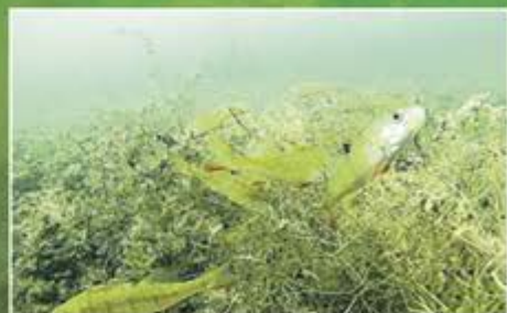
Taucher haben ihre helle Freude an spie-gelnden Barschen und dem Rauhen Hornkraut.