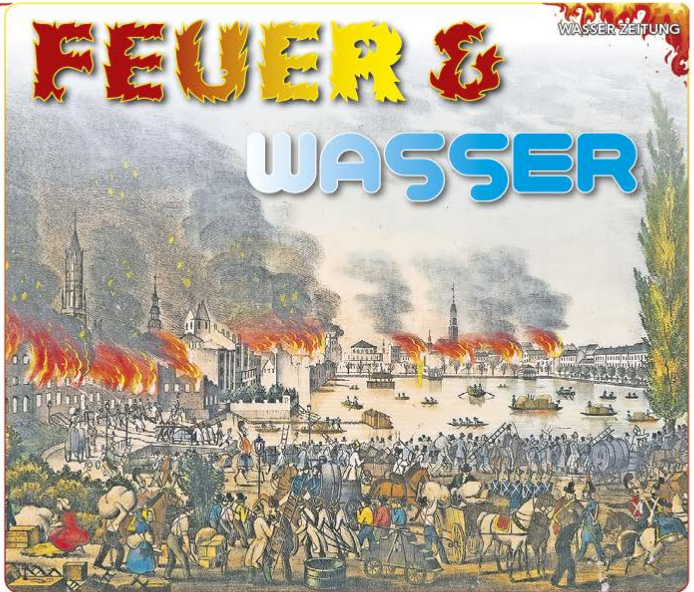
W. F. Wurzbach, Altona: „Der Brand von Hamburg Anno 1842“.

Die Löschmöglichkeiten waren zu dieser Zeit sehr begrenzt. Mehr als Wassereimer nutzen und Schneisen schlagen, um dem Feuer die Nahrung zu nehmen, blieb den Römern nicht. Nur vier der 14 Bezirke Roms blieben verschont, der Rest brannte fast vollständig nieder. Das Feuer ist seit Beginn der Zivilisation unser steter Begleiter. Es ist Werkzeug,