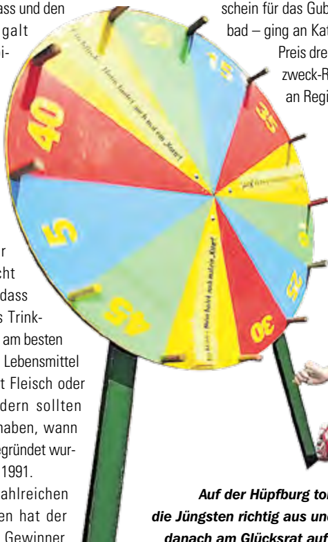
Auf der Hüpfburg tobten sich die Jüngsten richtig aus und hofften danach am Glücksrat auf Fortuna.