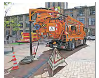
Der Stolz der GWAZ-Flotte: Mit dem neuen Hochdrucksaug- und -spülfahrzeug geht es durch das gesamte Verbandsgebiet. Mithilfe des Gefährtes werden Kanäle gereinigt und vieles mehr.