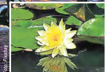
Wie gemalt: Die Gelbe Teichrose bildet fantastische Blütenteppiche.