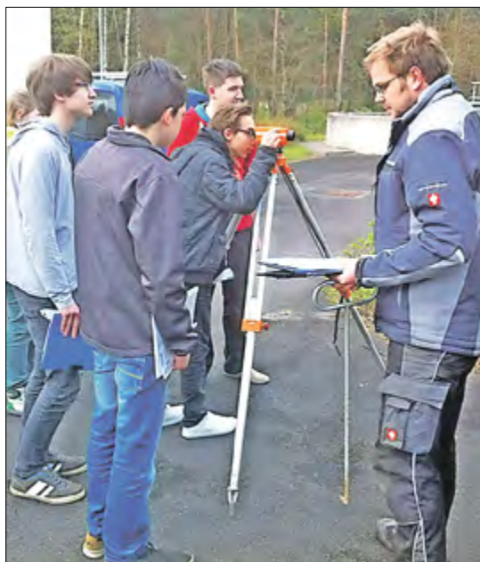
Blick über den Tellerrand und durch das Messgerät – beim Zukunftstag durften die Schüler beim GWAZ vieles ausprobieren.