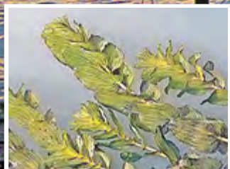
Auch „drunter“ trägt der See beeindruckende Pflanzenkleider.