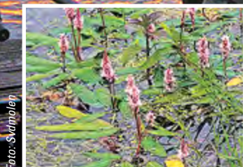
Beliebtes Fotomotiv: der Wasserknöterich in leuchtendem Pink.