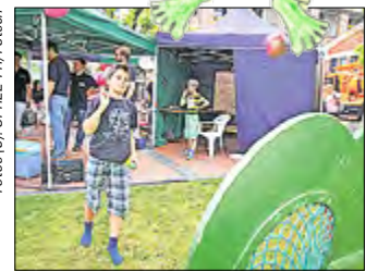
Anvisiert und getroffen – auch der Wurfbaum war bei den Kindern beliebt.