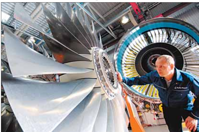
Die Rolls-Royce-Triebwerke aus Dahlewitz werden für die großen internationalen Flugzeughersteller Airbus, Boeing, Bombardier und Gulfstream hergestellt.

In Ludwigsfelde produziert Daimler-Chrysler Fahrgestelle für die Transporter „Sprinter“ und „Vario“. Die Avics Corporation AG entwickelt in Fichtenwalde Berlin-Schönfeld Software, die ein Schiff vorm Untergang bewahren kann. Dutzende Firmen aus Brandenburg sind global erfolgreich – auch Rolls-Royce Deutschland mit Sitz in Dahlewitz.