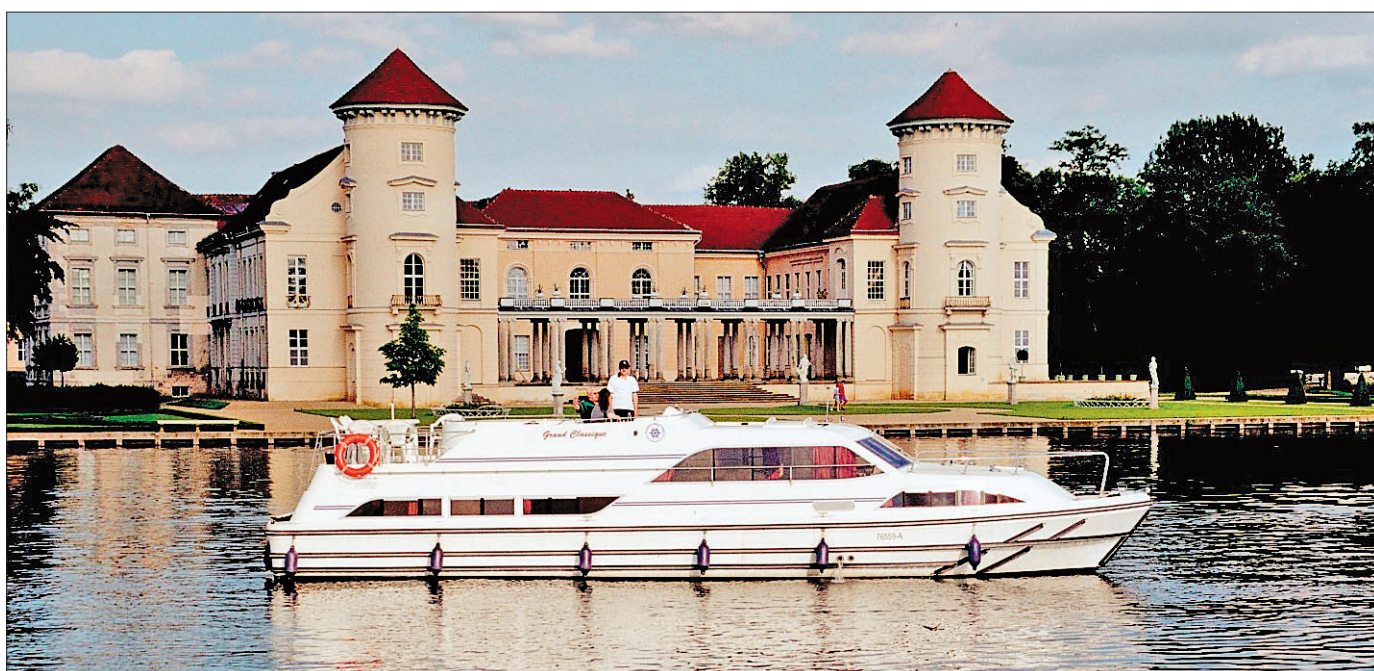
Als Käpt'n auf der Brücke vor der malerischen Kulisse des Schlosses Rheinsberg.

Ein Wochenende im Best Western in der Marina Wolfsbruch (2 Personen) Die Preise stellen die „Crown Blue Line“ und „Best Western Marina Wolfsbruch“ zur Verfügung.